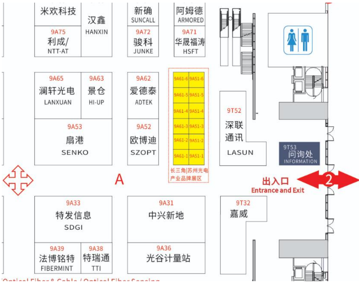
Optical Fiber & Cable / Optical Fiber Section